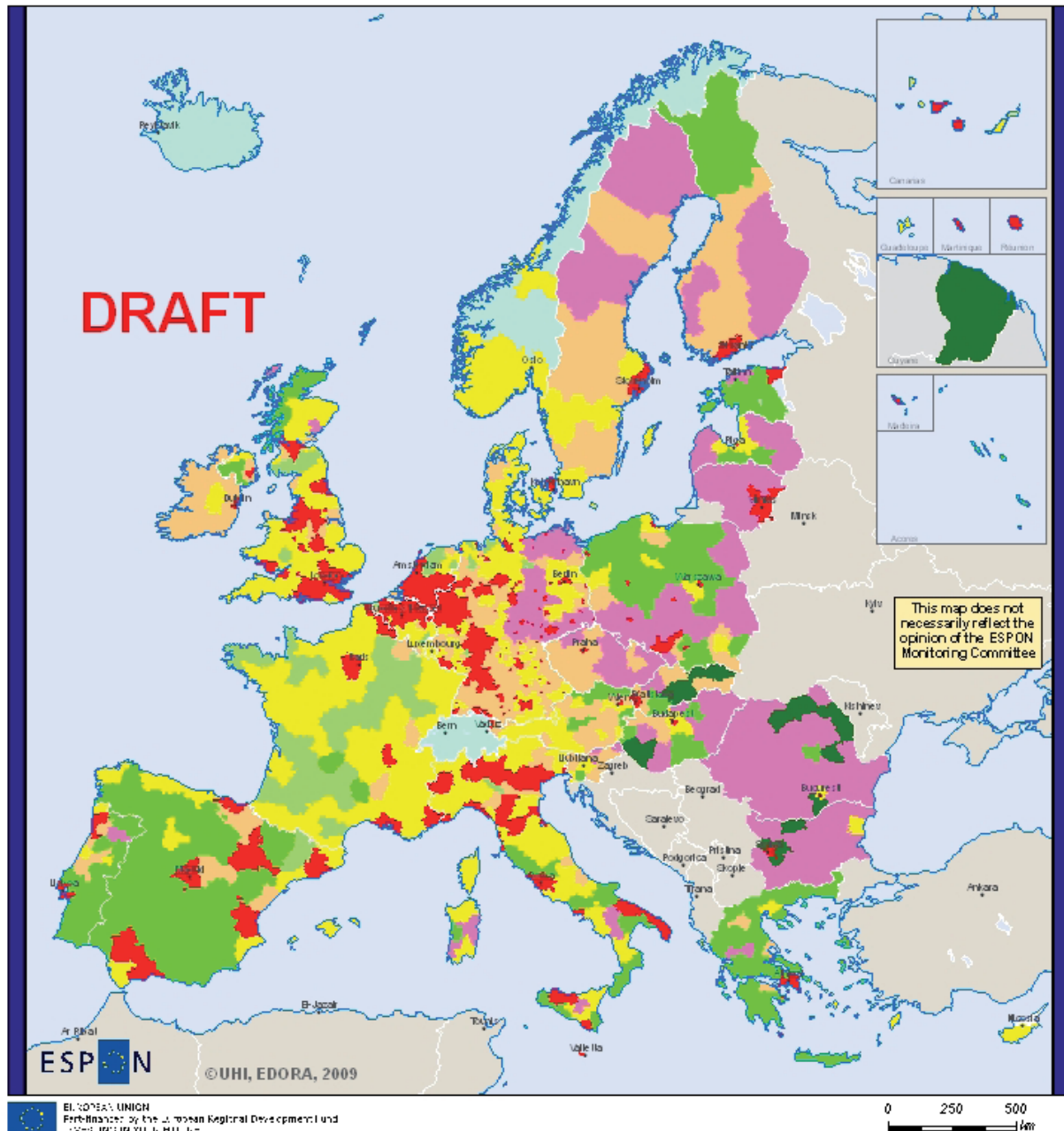
Figure 1, Version provisoire de la typologie EDORA, UE-27